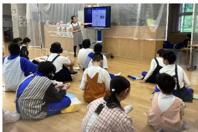
↑「オリエンテーション」 各班の目標→

5月28日(火)～31日(金)「作業週間」を実施しました。1日目には中学部全体で「オリエンテーション」を行い、作業週間の目的や目標を確認しました。毎日9時30分から12時まで、4つの作業班に分かれて作業学習に取り組み、31日の最終日には4日分の給料を受け取りました。翌週には、学年ごとに近くのコンビニへ行き、受け取った給料を使って、それぞれの好きなお菓子やジュース等を買いました。