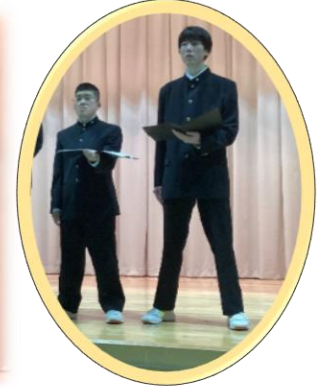
『メロンの心』を歌いながら合奏しました♪ 途中で踊っちゃいました！