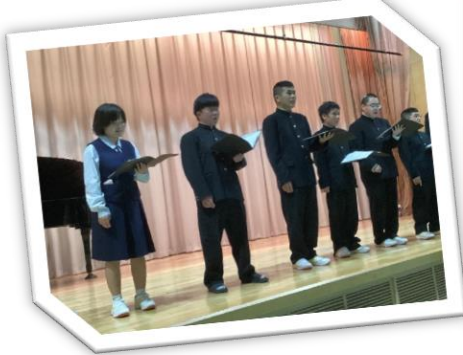
『大切なもの』を合唱しました♪

高等部はポップスやフォークソング、合唱曲など、さまざまな音楽ジャンルを、5つのグループに分かれて発表しました。それぞれ特色のある音楽を歌や合奏で表現することができました♪