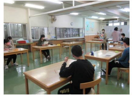
代表寄宿舎生による役員会