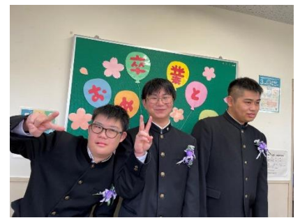
高等部3年生お別れ会