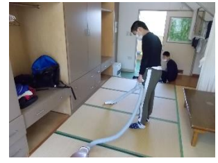
舎室の掃除機がけ