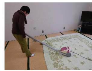
舎室の掃除機がけ