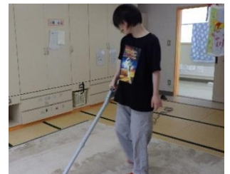
舎室の掃除機がけ